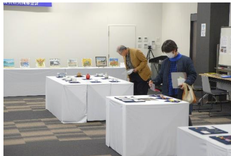
有名作家作品頒布展の様子