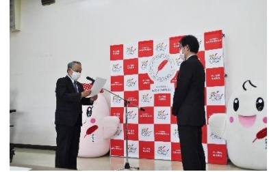
配分決定通知書交付の様子