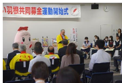
本会 陣内会長が運動開始を宣言。