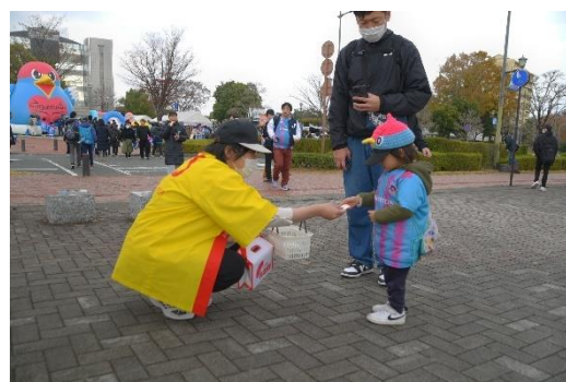
駅前不動産スタジアムでの募金活動の様子