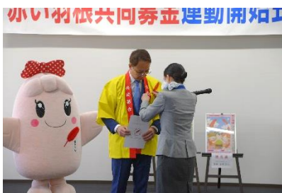
佐賀空港グラウンドスタッフが 佐賀県副知事に赤い羽根を着甲する様子。

県副知事、教育長、佐賀空港ANA関係者、募金ボランティア、デザイン・標語作品入賞者、市町支会役職員、本会役員・評議員