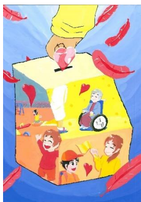
デザイングランプリ作品