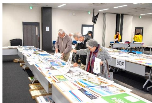
カレンダーバザーの様子